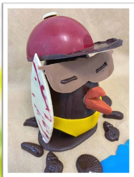
LE SURFER +/- 250grs 12,50 € TTC