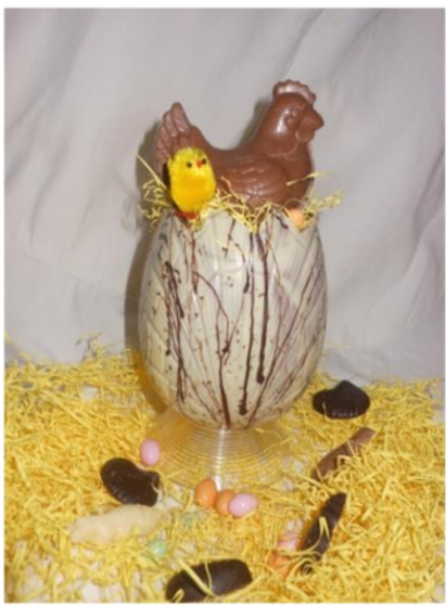
LA POULE DANS L'ŒUF +/- 280grs 13,30 € TTC (grand modèle)