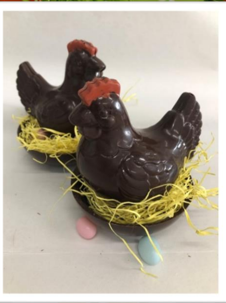
POULETTE DANS SON NID +/- 90grs 4,27 € TTC