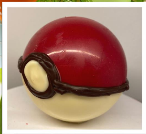
BOULE POKEMON +/- 100grs 8,50 € TTC