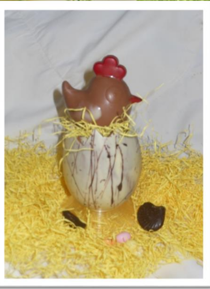
LA POULE DANS L'ŒUF +/- 160grs 7,59 € TTC (petit modèle)