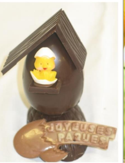
LA MAISON MINIATURE +/- 85grs 4,04 € TTC