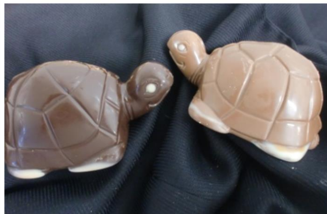
LA TORTUE +/- 85grs 4,04 € TTC