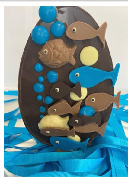
BANC DE POISSONS +/- 250grs 12,50 € TTC